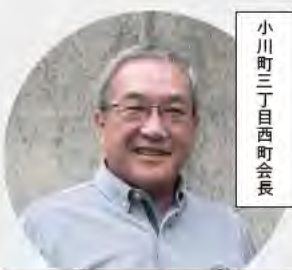
小川町三丁目西町会長

神田公園地区連合町会のホームページ「大好き神田」では、イベントの予告や報告、お知らせに加えて祭礼の知識や歴史写真館など、情報が集まっています。写真も豊富なのでご覧いただくと活動のイメージもわくでしょう。町会員が自分たちで更新できる仕組みとなっており、みなさん熱心に投稿しています。地域を共有するうえで、一番大切なのは「情報を公平に共有すること」だと考えています。新しい住民の方とも情報を共有していきたいですね。