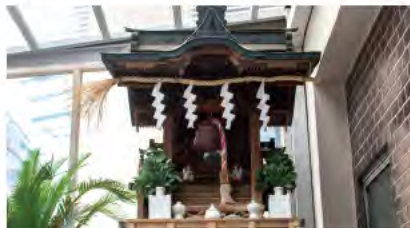
幸徳稲荷神社(大名屋敷より継承したもの)

P03、P05の地図の ㊦ マークは、稲荷神社の場所です。実際に訪れてみて、お気に入りの神社を見つけてみませんか？