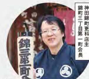
神田錦町更科店主 錦町三丁目第一町会長