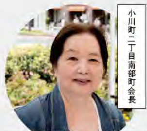
小川町二丁目南部町会長

一緒に応援することから始めてもいいと思います。そして、運営している人に話しかけてみてもらえたら。顔を合わせて、お茶したり、食事したりすることから、少しずつ関係をつくっていったらと思います。