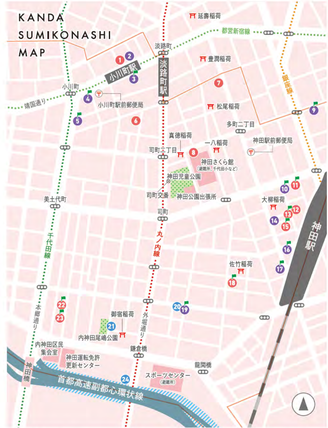
神田住みこなしサポーターのお店・立寄りスポット ■ 神田住みこなしサポーターのお店 ● 飲食店 ● 物販 ● その他スポット ㊦ 神社