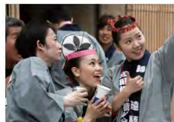
様々な人たちが集い、共に楽しむのが神田の祭りの特徴。あなたも参加してみませんか?