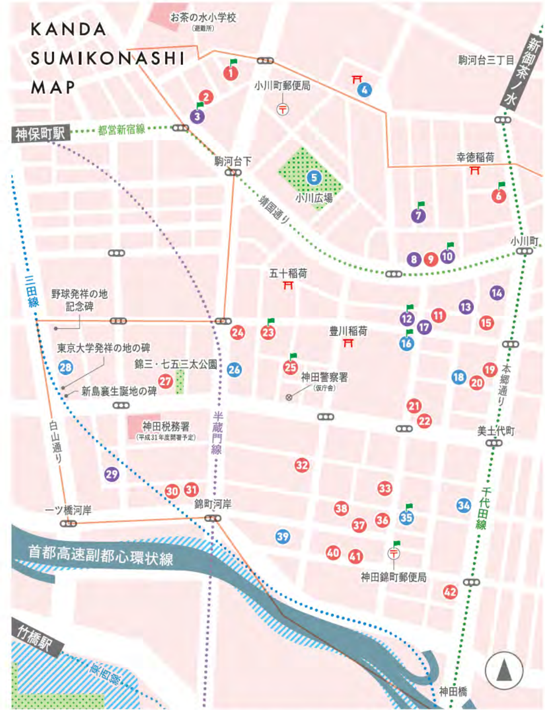
神田住みこなしサポーターのお店・立寄りスポット ■ 神田住みこなしサポーターのお店 ● 飲食店 ● 物販 ● その他スポット F 神社

東京大学発祥の地でもある「学士会館」は昭和3年の竣工で、国の有形文化財にも登録されています。会館には、日本野球発祥の地、同志社大学の創設者である新島襄生誕地の碑も。千代田区内各地に、様々な「発祥の地」があるので、訪ねてみると面白いですよ。