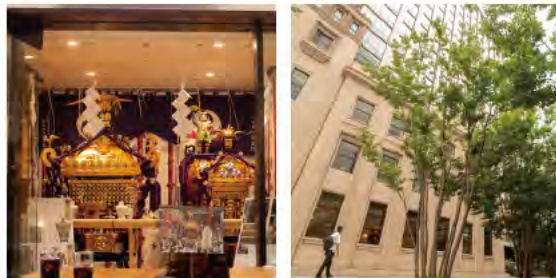
テラススクエア1階のHASSO CAFE with PRONTでは町会の神輿を展示 テラススクエアと錦三・七五三公園