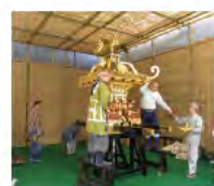
飾り付け前の神輿をまじまじと見られるのは準備の時だけの特権!