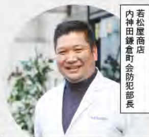
若松屋商店 内神田鎌倉町会防犯部長