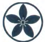
太田姫稲荷神社 (神田駿河台1-2-3)

祭りを守ってきた町会には、それぞれデザインされた半纏があります。自分の住む町の半纏の人を見つけてみましょう。