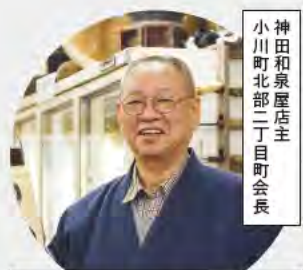
神田和泉屋店主 小川町北部二丁目町会長