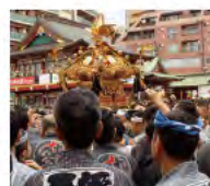
祭りの当日! 神輿の掛け声や迫力、町の一体感を楽しもう!