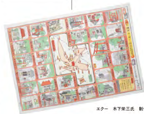
エクー 木下栄三氏 制作

神田の町を歩くと、多数の稲荷に出会えます。ビルの間にあるものもあれば、ビルの屋上などにもあるようです。由緒も、町の鎮守だったものや、また屋敷稲荷が解放されたものなど様々です。江戸時代から残るものも多く、永い時の中で数多くの方が守り、お詣りしてきたものばかりです。稲荷を見かけたら、過去の町に思いをさせて、お詣りしてはどうでしょう。