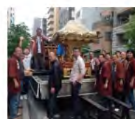
お疲れ様! 祭りのあとの余韻も楽しもう